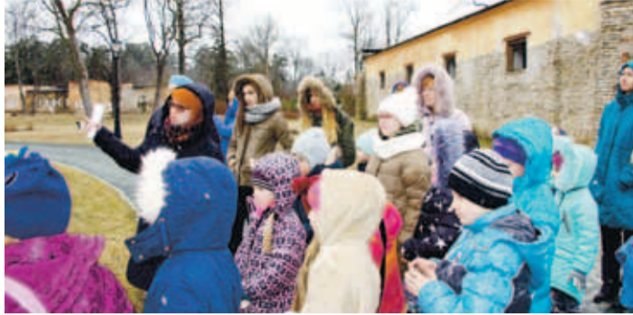
Rääkisime uusgootikast, mis on romantismiajastu üks värvikamaid suundi.