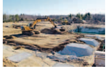
Kalatöötlemistehase ehitusplats märtsis 2017.