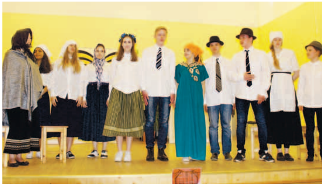
Актерский состав спектакля “Тийна”, или “Иванов день”, в день театра.