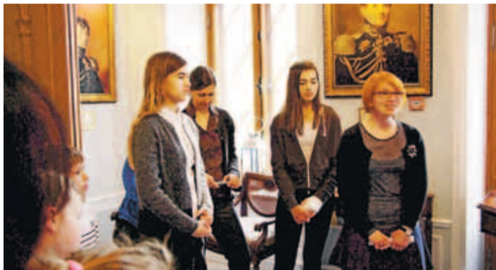
Состоялась поездка Палдиской Художественной студии Бьярте в замок Фалль (Кейла-Йоа).