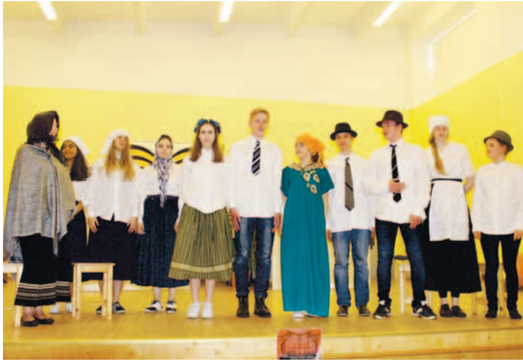
Etendus “Tiina” ehk “Jaanipäev” trupp teatripäeval.

29. märtsil peeti ühisgümnaasiumis suurejoonelist teatripäeva. Idee pidada seda laiemalt tuli taas tänu teatriõpetu-