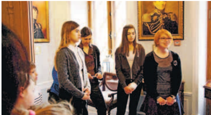
Toimus Paldiski kunstistuudio Bjarte väljasõit lossi Schloss Fall (Keila-Joa).