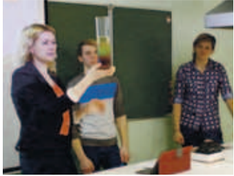
Programmis olid katsed.