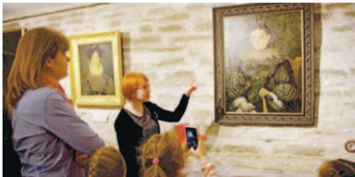
Ilmekas näide on tolle aja kleidid ja portreed, ehted ning lossi enda arhitektuur.