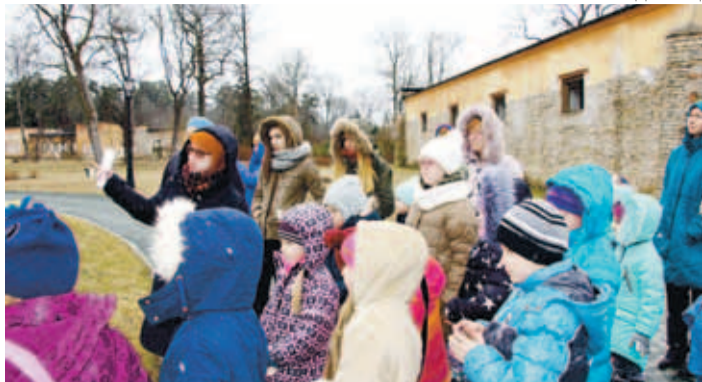
Мы поговорили о неоготике – одном из ярких направлений эпохи романтизма.