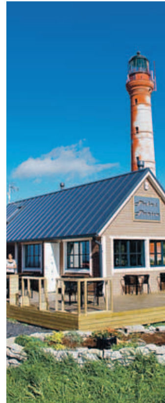
Pakri Parun OÜ kohvik ja tuletorn.