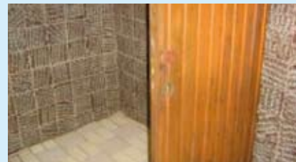
Käepidemeta uks on meie linna saunas vaid tähtsusetu pisiasi