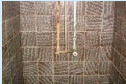
Roostes torudega kraanid mäletavad ka paremaid aegu

Võib öelda, et sauna pole elementaarsemalgi tasemel hooldatud. Enne sauna üleandmist ei vaevunud sauna juhataja seda kordagi tegema, selle asemel osutusid duširuumide segistid mingil saladuslikul kombel väljavahetatuks roostes segistite vastu ning sauna välissilt, mis oli küllastajaid mitme aasta vältel tervitanud, oli barbaarselt maha rebitud. Tehnoruum meenutab rohkem prügimäge. Sinna ladustatud kõdunenud kaltsud, toidujäätmed, õllepurgid ja muud „abivahendid“ levitavad püsivat vastikut haisu, mis annab endast tunda juba majja sisenemisel.